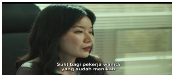
gambar 4. wanita terkena dampak pemiskinan ekonomi karena terkena proses peminggiran sumber 4: potongan film kim ji young, born 1982