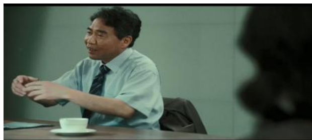
gambar 6. jabatan tertinggi selalu dipegang oleh laki-laki

Pada teks tersebut, dimana Hye Soo mengatakan “ Kau harus berterima kasih, karena kepala Kim memilihmu. Dia hanya memilih lelaki. ” Menunjukkan bahwa penilaian mengenai wanita dianggap lebih rendah daripada laki-laki. Sehingga wanita tidak dapat ditempatkan pada posisi yang sama dengan laki-laki, serta wanita masih kurang diapresiasi dalam pekerjaannya. Meskipun kinerja yang dimiliki oleh wanita bagus, namun akan tetap dianggap lebih rendah daripada laki-laki. Oleh sebab itu, dalam adegan tersebut, dipertontonkan betapa timpangnya posisi yang diperoleh oleh wanita dalam sektor publik. Selain itu, pemilik keputusan dalam perusahaan juga laki-laki.