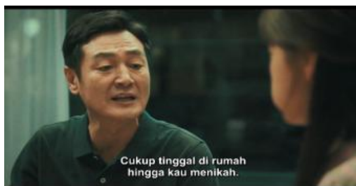
Gambar 3. ayah ji young menunjukkan stereotipe bahwa wanita bekerja dirumah domestik saja.