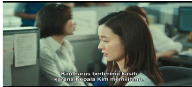
gambar 5. hanya pegawai laki-laki yang dipilih untuk posisi terbaik