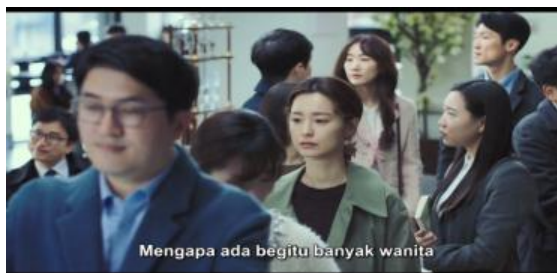
gambar 7. laki-laki melakukan kekerasan verbal kepada wanita di sebuah cafe