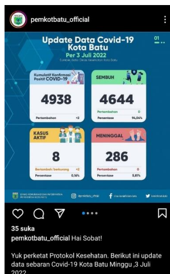
Gambar 5 Pemkot Batu menyosialisasikan tentang COVID-19 kepada masyarakat melalui Instagram pada Juli 2022

Penyebaran informasi terbaru tentang perkembangan virus, promosi undang-undang kesehatan, dan pendidikan masyarakat umum adalah contoh inisiatif advokasi Covid-19 yang prospektif. Sosialisasi kebijakan seperti penutupan bar, pasar, dan tempat ibadah serta pemantauan harga kebutuhan seperti makanan dan obat-obatan adalah beberapa contohnya. Contoh lain termasuk pemantauan harga kebutuhan seperti makanan dan obat-obatan. Sementara itu, kelompok tersebut berusaha untuk meningkatkan kesadaran di kalangan masyarakat umum tentang banyak hasil positif yang dapat dicapai dengan menerapkan pilihan gaya hidup yang lebih sadar lingkungan dan aktif secara fisik. Pemkot Batu telah melakukan pekerjaan yang luar biasa dalam mewujudkan hal ini melalui banyak platform media sosialnya.