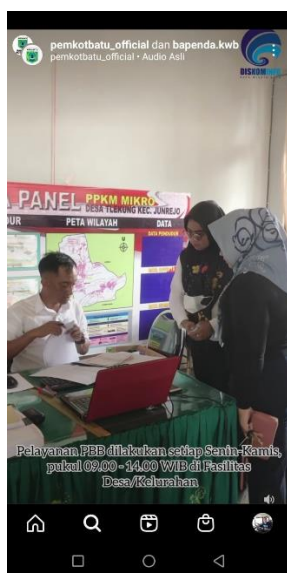
Gambar 6. Humas Pemkot Batu membuat video reels tentang layanan pajak

Tujuan dari Humas Pemkot Batu adalah untuk menginformasikan kepada masyarakat umum tentang kegiatan pemerintah dan langkah-langkah yang telah dicapai untuk perbaikan infrastruktur negara. Ini dapat membantu individu memahami keuntungan dari inisiatif semacam itu dan meningkatkan penghargaan mereka terhadapnya, serta meningkatkan minat publik terhadap proyek yang sedang berlangsung. Contoh video reel Instagram menarik yang memberikan informasi tentang pembayaran pajak di Kota Batu dapat dilihat lebih jauh di halaman ini. Reel tersebut diunggah oleh Humas Pemkot Batu. Masyarakat umum dapat memahami informasi semacam ini, dan penyebarannya akan mendorong pembayaran pajak yang cepat dari penduduk setempat.