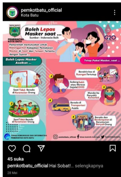
Gambar 14 Humas Pemkot Batu turut menkampanyekan bebas masker dari pemerintah pusat

Dalam bidang kebijakan publik, "penjangkauan pemerintah" mengacu pada praktik mendidik publik tentang kebijakan yang sedang dilakukan pemerintah dalam upaya untuk mendapatkan dukungan dari masyarakat umum. Instansi pemerintah harus dapat menunjukkan bahwa ia menyediakan layanan berkualitas tinggi kepada masyarakat umum, beroperasi dengan cara yang efektif, dan menghormati orang-orang yang bekerja untuknya.