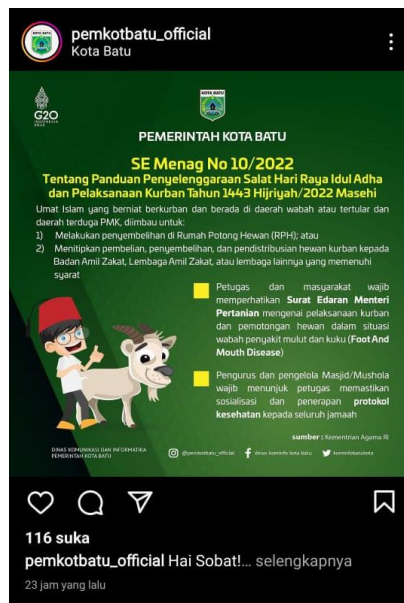
Gambar 12 Unggahan Humas Pemkot Batu terkait Surat Edaran Menag tentang Hari Raya Idul Adha 2022

Informasi di atas sangat erat kaitannya dengan kebutuhan Humaniora untuk mendukung peraturan pemerintah dan perundang-undangan baru agar dapat diketahui dan dipahami oleh masyarakat luas. Sumber daya humas yang dipekerjakan oleh pemerintah, seperti yang bekerja di Humas Pemkot Batu, berkontribusi pada pembentukan koneksi eksternal dengan melakukan upaya untuk mendidik masyarakat umum dengan cara yang sesuai dengan tujuan dan prosedur operasi yang telah diartikulasikan oleh pemerintah. organisasi. Fungsi Humas Pemkot Batu adalah sebagai penyalur emosi, ambisi, atau pandangan khalayak guna memajukan kepentingan seluruh golongan. Sebagai konsekuensi langsung dari perkembangan ini, sumber daya pemerintah dialokasikan kembali untuk perluasan dan peningkatan pelayanan publik.