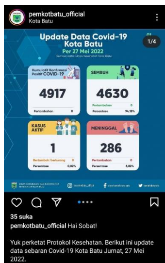
Gambar 4 Pemkot Batu menyosialisasikan tentang COVID-19 kepada masyarakat melalui Instagram pada Mei 2022