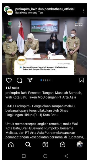
Gambar 1 Salah satu informasi pada IG Pemkot Batu tentang penanganan sampah dengan MoU Bersama PT Arta Asia

Sangatlah penting, untuk memaksimalkan efisiensi setiap program pemerintah, memanfaatkan kontribusi yang diberikan oleh kehumasan untuk melakukan sosialisasi yang sukses dengan penduduk. Istilah "sosialisasi" mengacu pada proses di mana norma dan tradisi masyarakat dikomunikasikan dari satu generasi ke generasi berikutnya sepanjang sejarahnya. Istilah "teori peran sosial" sedang digunakan oleh semakin banyak ilmuwan sosial saat ini. (teori peran). Karena fakta bahwa seseorang belajar tempatnya dalam proses sosialisasi dari orang lain, (Widjaja, 2019).