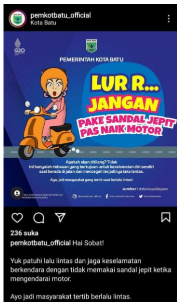
Gambar 11 Unggahan Humas Pemkot Batu terkait imbauan pengendara sepeda motor yang menggunakan sandal