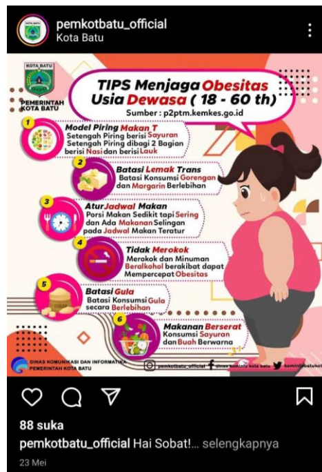
Gambar 8. Informasi tentang menjaga kesehatan dari obesitas di Instagram Pemkot Batu

Sebagai sumber informasi yang paling dapat diandalkan untuk masyarakat umum, humas memainkan peran penting dalam proses penerapan undang-undang ini. Terutama, aturan ini mengamanatkan bahwa semua lembaga pemerintah harus memastikan bahwa publik memiliki akses ke informasi yang tersedia secara bebas, serta informasi yang dapat diperoleh secara tepat waktu, akurat, dan dengan biaya yang terjangkau. Fakta bahwa peraturan ini ada memberi humas keyakinan diri yang mereka butuhkan untuk berpartisipasi dalam kegiatan profesional. Khususnya untuk tujuan menginformasikan kepada publik tentang tindakan yang diambil oleh pemerintah, baik melalui pendokumentasian proses internal maupun transmisi informasi kepada publik melalui media. Sejak pertama kali diperkenalkan pada tahun 2010, masyarakat Humas Pemkot Batu telah memanfaatkan platform jejaring sosial Instagram secara efektif.