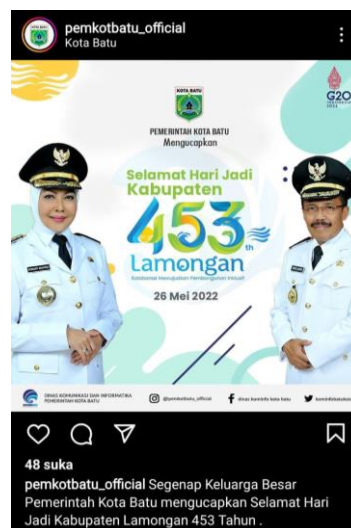
Gambar 2 Pemkot Batu mengucapkan Selamat memperingati Hari Kenaikan Isa Almasih Gambar 3 Pemkot Batu mengucapkan Hari Jadi Kabupaten Lamongan yang ke 453

Apapun yang dilakukan oleh Humas Pemkot Batu di atas sesuai dengan tanggung jawab dan fungsi sumber daya humas pemerintah agar tercipta komunikasi dua arah baik dengan menyebarkan informasi dari organisasi kepada pihak masyarakat yang dimaksudkan untuk mendidik dan menasihati, atau dengan terlibat dalam penjangkauan persuasif untuk menumbuhkan pemahaman dan penghargaan bersama. Hal ini dianggap sebagai upaya untuk membangun hubungan baik antara bisnis dan kelompok pemangku kepentingan yang berbeda untuk mempromosikan kerja sama baik di tingkat internal maupun eksternal organisasi. Adalah tugas humas untuk memberi tahu publik tentang tugas yang telah diberikan kepada mereka agar misi tersebut dapat diterima oleh publik dan untuk mendapatkan dukungan dari publik. (publik sasarannya).